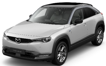
48A Ceramic White