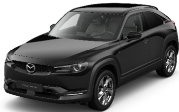
41W Jet Black