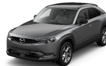
46G Machine Gray