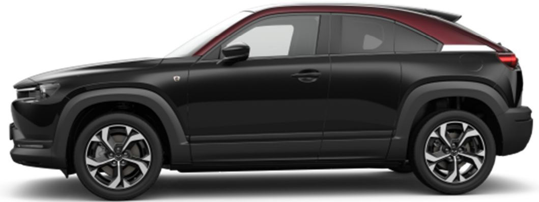
18" Black Diamond Cut alumiinivanteet (215/55R18)