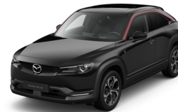
49F Jet Black – Maroon Rouge