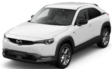
A4D Arctic White