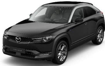
49P Jet Black - Silver