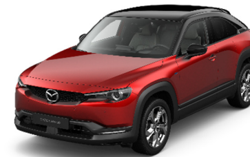
49V Soul Red Crystal