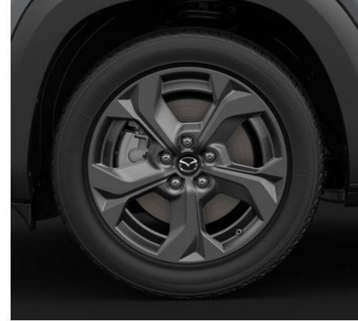
18" Grey Metallic alumiinivanteet (215/55R18)