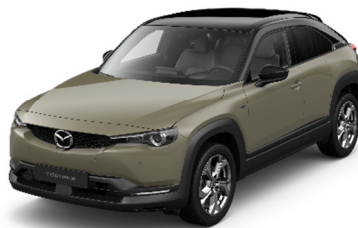
49T Zircon Sand