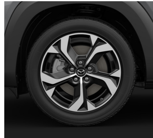
18" Black Diamond Cut alumiinivanteet (215/55R18)